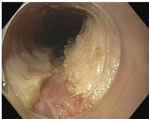
Detalle del corte de fibras musculares en el esófago distal durante la realización de un POEM