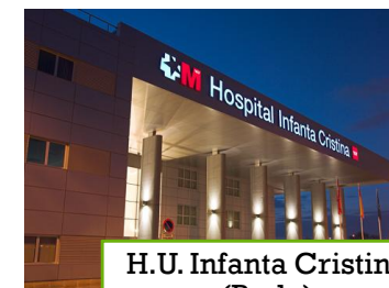
H.U. Infanta Cristina (Parla)