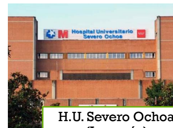
H.U. Severo Ochoa (Leganés)