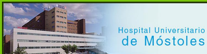
Hospital Universitario de Móstoles