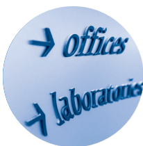
Percepción distorsionada u ondulada de líneas rectas