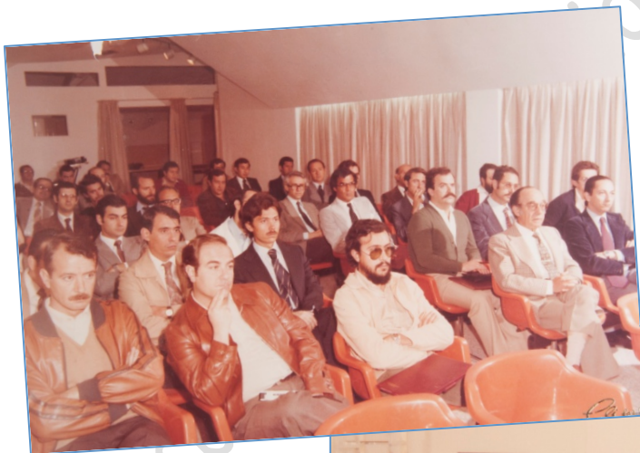
Curso sobre colgajo de Demergaso (Gran Hospital-1979)