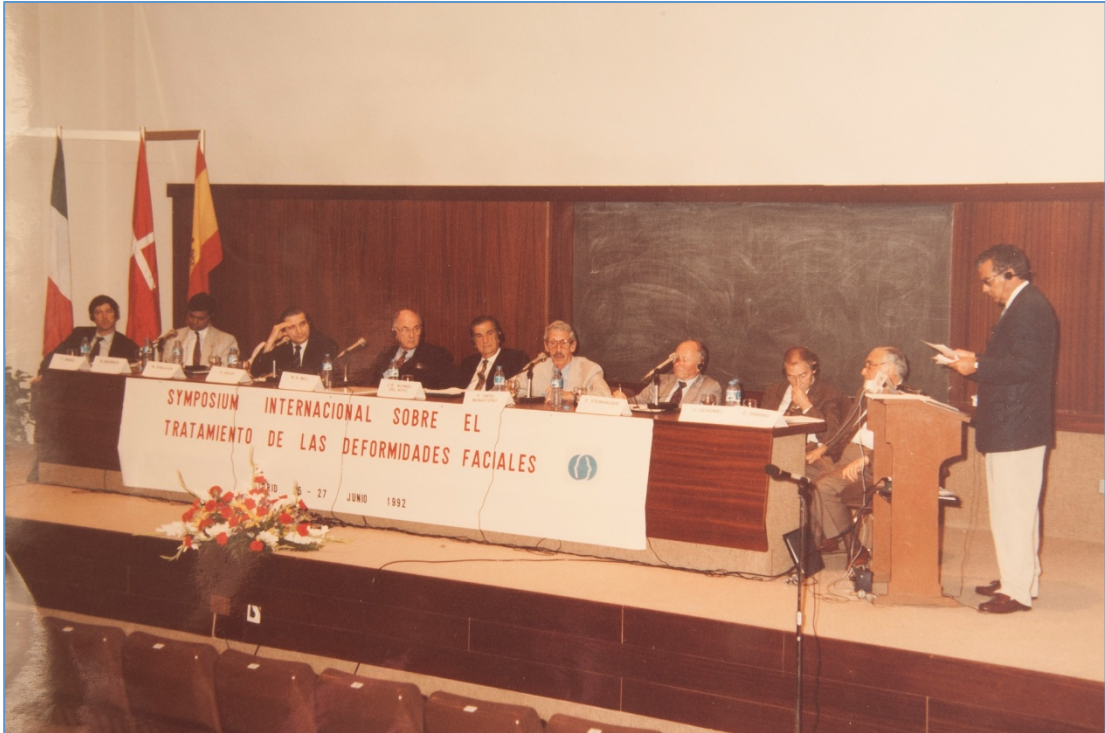
Simposio Internacional sobre Deformidades Faciales – Gran Hospital (1992)

No hubo conflictos ni médicos ni laborales en este periodo.