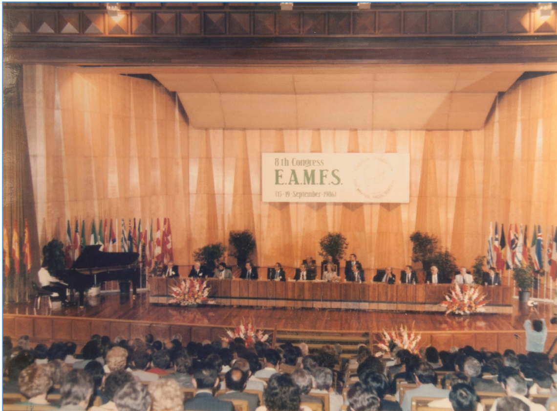
Inauguración del VIII Congreso de la Sociedad Europea de Cirugía Maxilofacial (1986)

Entre los años 1986 y 1990 se crearon en el Servicio tres nuevas unidades que no existían en España: