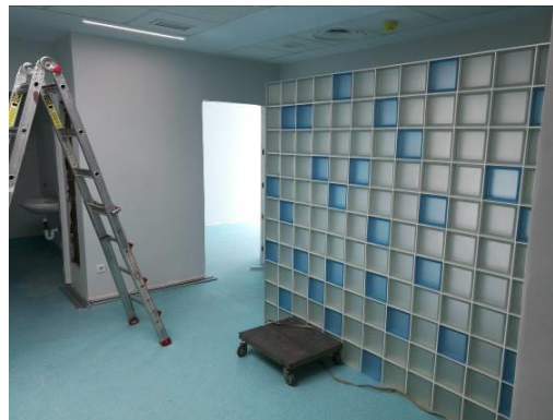
Consultas oftalmología y psiquiatría: