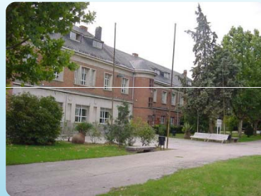
Calle Aragón Nº 17 28914 LEGANES ☎ 915 86 65 73