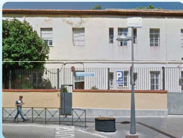
Paseo de Colon S/N 28911 LEGANES ☎ 915 86 65 25