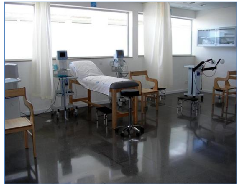
Sala de electroterapia