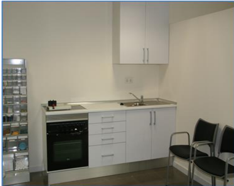
Actividades de la vida diaria