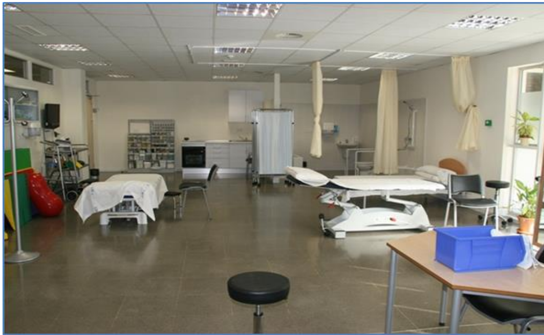
Sala de Terapia ocupacional