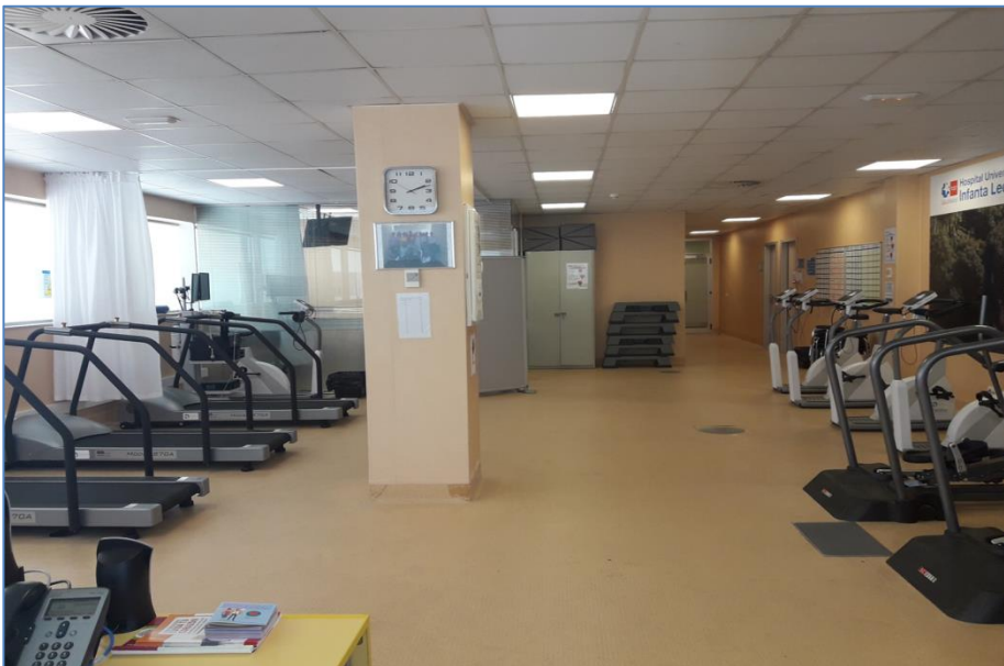
Sala de Rhb cardiaca