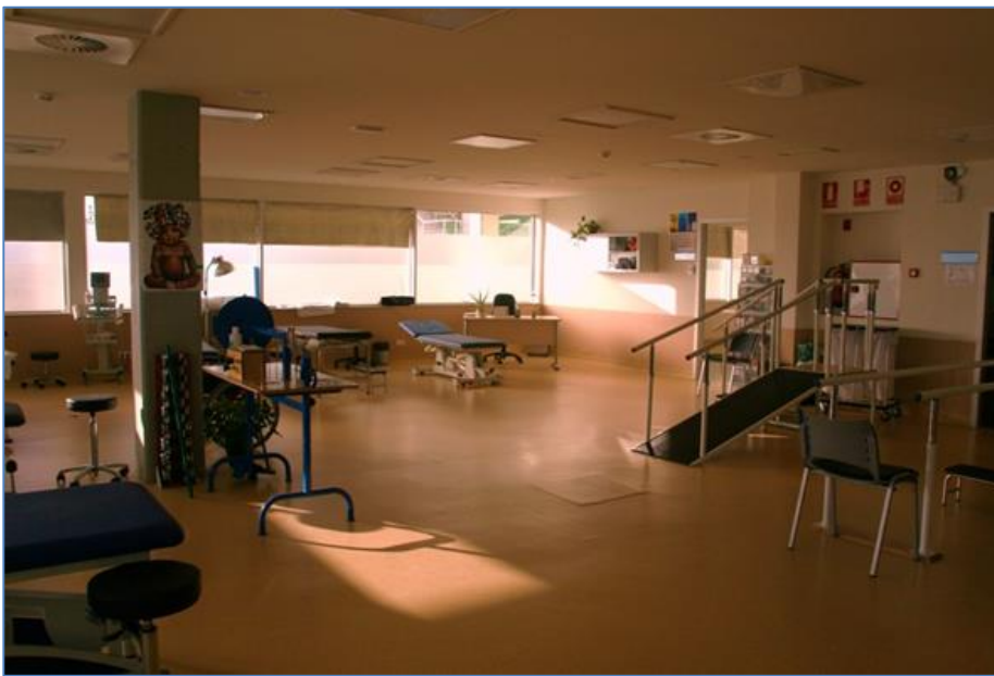
Sala de Fisioterapia