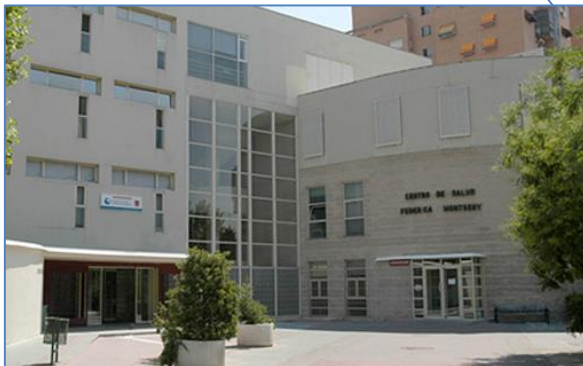
CEP Federica Montseny