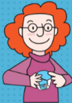
Cerrar el dispositivo