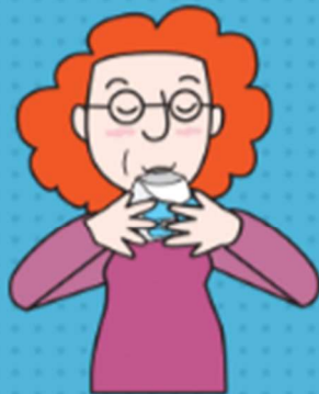
Inspirar (coger aire energicamente)