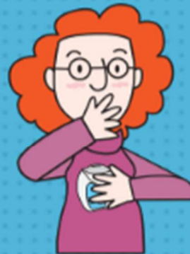
Aguantar la respiración 10 segundos