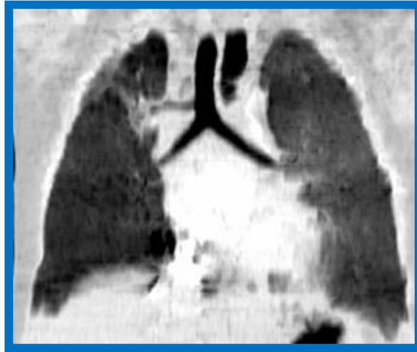
Figura 3. TC de tórax (reconstrucción MPR coronal). Se observa el origen del bronquio lobar superior en la cara lateral derecha del tercio inferior de la tráquea