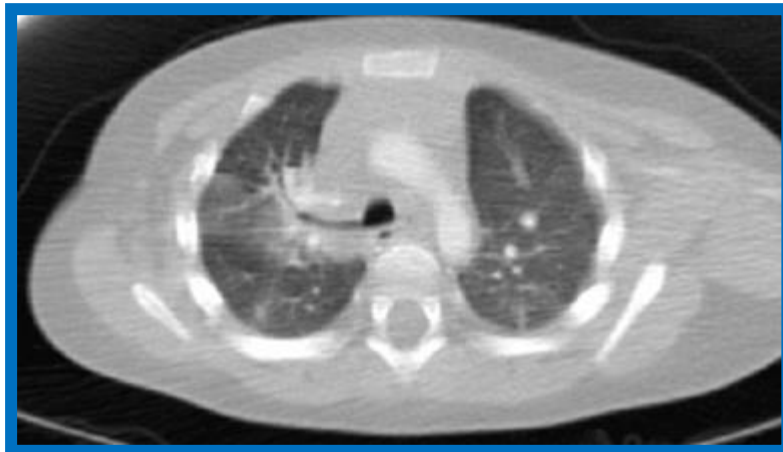
Figura 2. TC de tórax (corte axial). Se aprecia un bronquio traqueal derecho y un foco consolidativo distal a éste, que corresponde a una consolidación neumónica