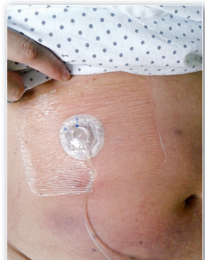
Figura 1. Reacción inflamatoria local tras la administración de treprostínil subcutáneo

El implante se llevó a cabo con anestesia general y con soporte de radioscopia, en el quirófano de cirugía cardíaca. A nivel del surco deltopectoral izquierdo se localizó y disecó la vena cefálica, por donde se introdu-