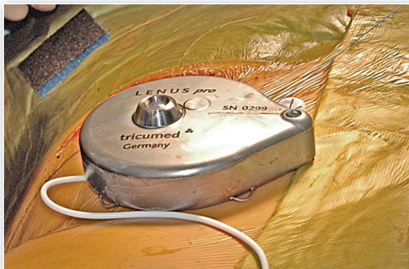
Figura 2. Bomba LENSUS pro® en el implante

La bomba LENSUS pro® es un dispositivo especialmente diseñado para la administración intravenosa de treprostinil que permite evitar los problemas derivados tanto de la admi-