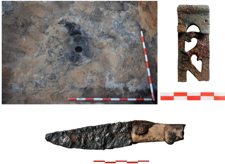
Hallazgo del molino rotatorio y piezas recuperadas durante la excavación del área correspondiente al centro productivo: pinzas caladas y cuchillo con empuñadura.

En otra de las áreas excavadas se documentó una zona habitacional más compleja y distinguida que la anterior, posiblemente un santuario. En esta zona se produjo además, el hallazgo de una phiale de plata y oro. En una de las estancias también se han hallado numerosos objetos de bronce y hierro junto a fragmentos de madera quemada que parecen pertenecer a uno o varios elementos, como placas decorativas de un posible mueble.