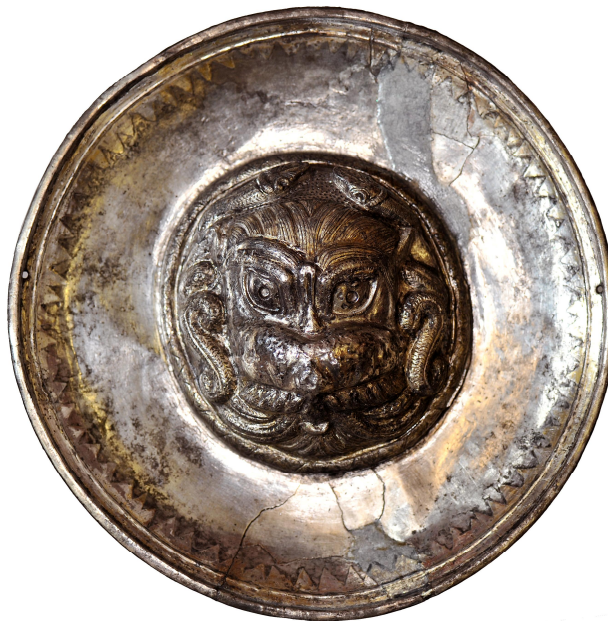
Phiále de oro y plata hallada durante los trabajos de excavación de 2009

En otra de las áreas excavadas se documentó una zona habitacional más compleja y distinguida que la anterior, posiblemente un santuario. En esta zona se produjo además, el hallazgo de una phiale de plata y oro. En una de las estancias también se han hallado numerosos objetos de bronce y hierro junto a fragmentos de madera quemada que parecen pertenecer a uno o varios elementos, como placas decorativas de un posible mueble.