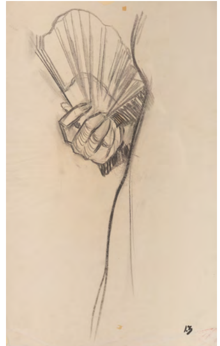
IGNACIO ZULOAGA ZABALETA (Éibar, 1870-Madrid, 1945). «Estudio de mano femenina con abanico», s. f. Carboncillo sobre papel. Colección Zuloaga. © Ignacio Zuloaga Zabaleta.

Por eso dibujar es una forma de pensar . Al mover la mano, las ideas van apareciendo poco a poco. El dibujo nace mientras se hace, y la mano ayuda a encontrar la forma final.