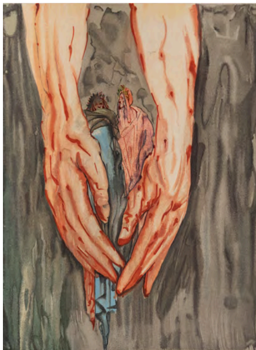
SALVADOR DALÍ (Figueras, 1904-1989). «En las manos de Anteo (Suite de la Divina Comedia)», 1964. Xilografía en color sobre papel. Colección Zuloaga.