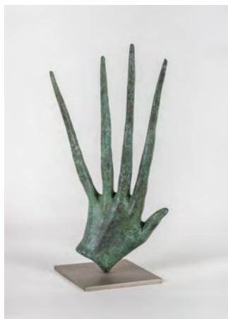
DORA SALAZAR (Alsasua, 1963). «Mano de dedos largos y finos», c. 2000. Bronce patinado. Colección Zuloaga.

Lorenzo Quinn (1966) es un destacado artista plástico y escultor italiano, reconocido internacionalmente por sus impactantes obras a gran escala.