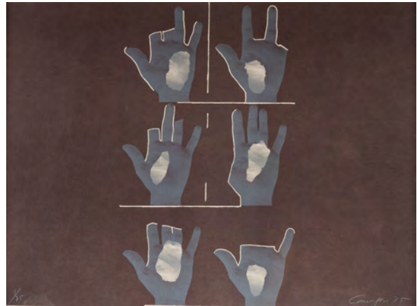
RAFAEL CANOGAR (Toledo, 1935). «Composición con manos», 1975. Litografía a tres tintas sobre papel Guarro. Colección Zuloaga. © Rafael Canogar, VEGAP, Madrid, 2026.

Rafael Canogar (1935) es uno de los artistas más influyentes del arte contemporáneo español, una figura clave en la introducción de la abstracción y el informalismo en España durante el siglo XX.