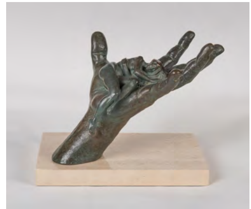
LORENZO QUINN (Roma, 1966). «Confianza», 2002. Escultura en bronce. Colección Zuloaga. © Lorenzo Quinn, VEGAP, Madrid, 2026.

Aunque haya una persona que imagina la obra, hacer una escultura de bronce es un trabajo en equipo . En la fundición trabajan muchas personas y muchas manos para que la escultura llegue a existir.