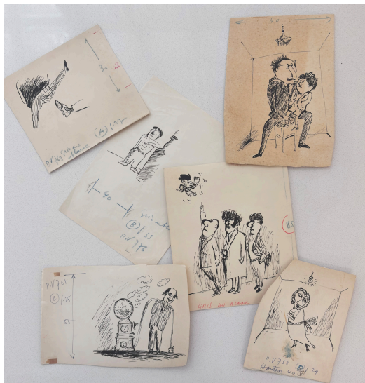
Algunos ejemplos de ilustraciones de Eduardo Arroyo, 1963. Galería Álvaro Alcázar.