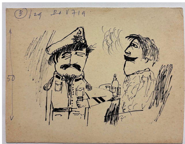
Eduardo Arroyo (Madrid, 1937-2018). «Sin título», 1963. Tinta sobre papel o cartón.

También le gustaba pintar personajes muy conocidos de la cultura popular y del arte . A veces tomaba figuras famosas de cuadros o esculturas, como la «Mona Lisa» o la «Dama de Elche».