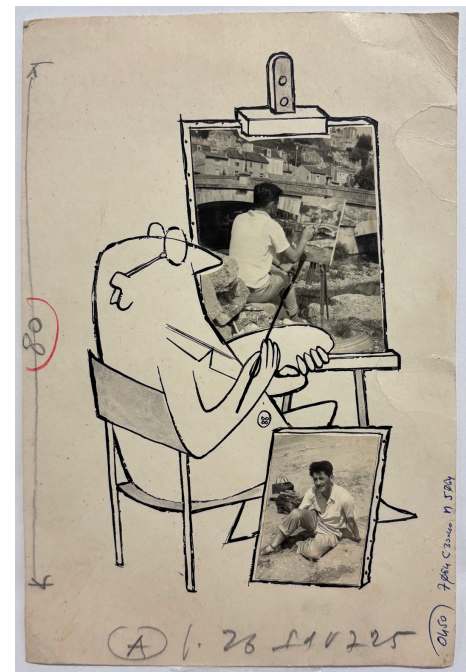
Eduardo Arroyo (Madrid, 1937-2018). «Sin título», 1963. Tinta sobre papel o cartón.

En lugar de mostrarlo dando un discurso o tomando decisiones importantes, el artista lo retrata pintando al aire libre, una de sus aficiones más conocidas, tranquilamente, como una persona normal que pinta por gusto los fines de semana.