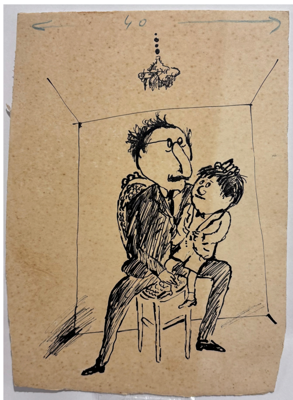
Eduardo Arroyo (Madrid, 1937-2018). «Sin título», 1963. Tinta sobre papel o cartón.

Eduardo Arroyo dialogaba con la historia del arte en muchos de sus cuadros. Era uno de sus temas favoritos, y llegó a publicar su propia guía del Museo del Prado, interpretando muchas de sus obras. Velázquez fue uno de sus artistas más admirados, aunque no el único; también admiraba a Goya y a Picasso.