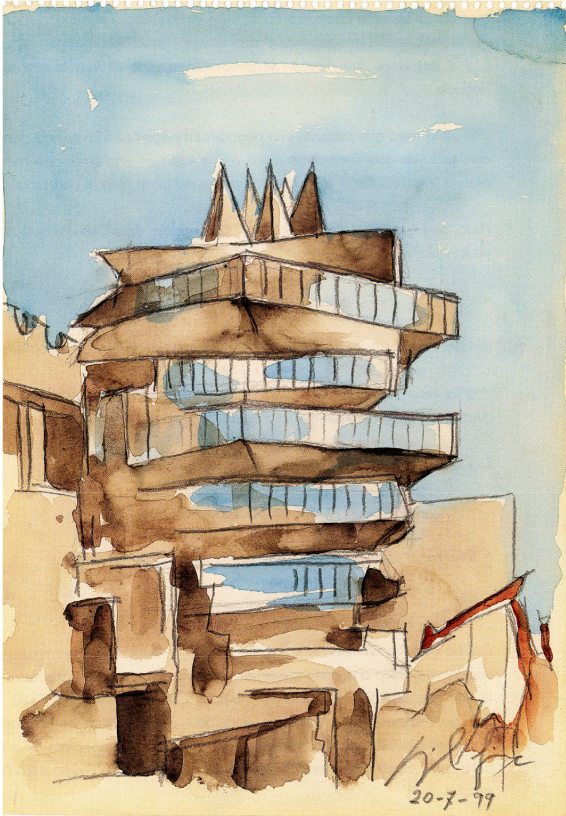
MIGUEL FISAC. «La Pagoda», 1999. Acuarela (facsimil). Colección Fundación Fisac.