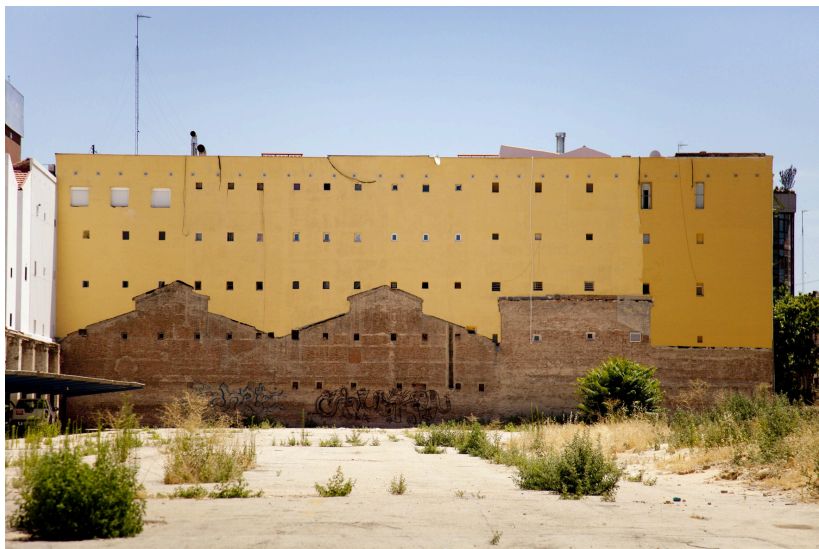
JAVIER CAMPANO. «Madrid, 2011», 2011. Fotografía. Colección Museo Centro de Arte Dos de Mayo (CA2M).

Mirar estas huellas nos ayuda a imaginar cómo era antes la ciudad y a descubrir que los lugares guardan secretos y recuerdos.