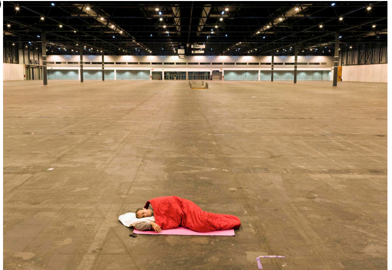
EUGENIO AMPUDIA. «Dónde dormir III (Arco)», 2013. Fotografía. Cortesía del artista. © Eugenio Ampudia, VEGAP, Madrid, 2026.

¿Qué crees que el artista quiere decirnos con esta foto?