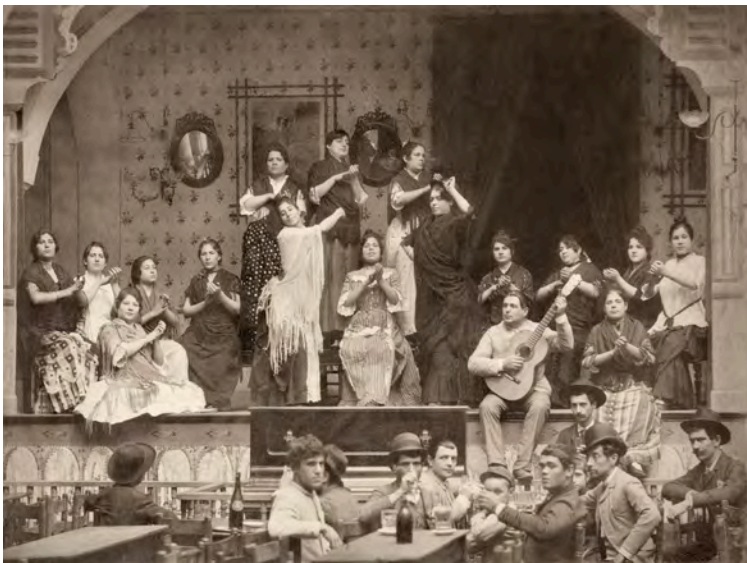
EMILIO BEAUCHY. Café Cantante del Burrero (Sevilla). A la derecha de la imagen, tocando la guitarra, el legendario cantaor Silverio Franconetti. Hacia 1880. Colección Juan Antonio Fernández Rivero.

Pero eso tuvo algo bueno: hoy podemos mirar esas fotos y apreciar todos los detalles, como la ropa que llevaban, los peinados, los instrumentos musicales, etc. Es como si estuviéramos viajando en el tiempo, viendo cómo vivían y qué cosas eran importantes para ellos. Y lo más curioso es imaginar lo difícil que debía ser quedarse quieto tanto tiempo... ¡Como si tuvieran el superpoder de la paciencia!