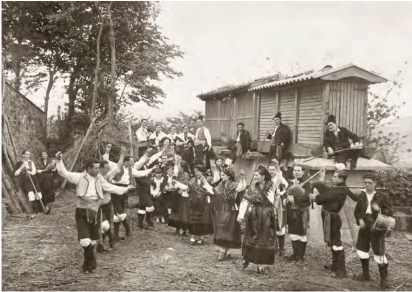
ANÓNIMO. Coro Cántigas da Terra, creado por intelectuales vinculados a las Irmandades da Fala desarrolló su actividad en Galicia y América desde 1916. Ribadavia (Ourense), hacia 1940. Archivo Cántigas da Terra.