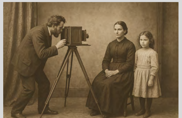
Imagen creada con la ayuda de ChatGPT.