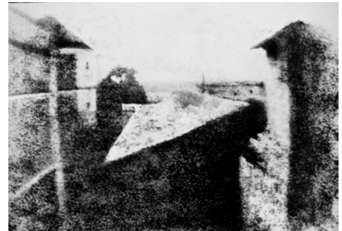
JOSEPH NICÉPHORE NIEPCE. «Vista desde la ventana de Le Gras», 1824.

Joseph Nicéphore Niépce hace una foto desde la ventana de su casa. ¡Tardó horas en aparecer!