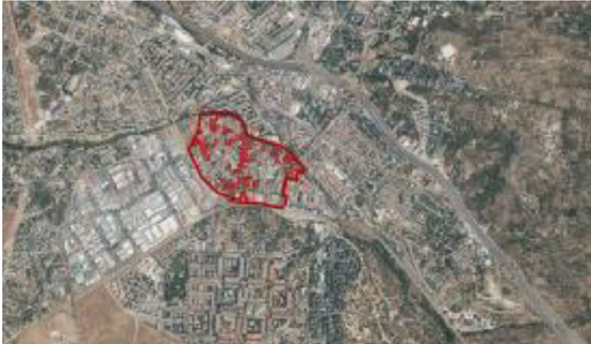
Localización del ERRP “El Gorrional. Fase I” en el municipio de Collado Villalba de Madrid.