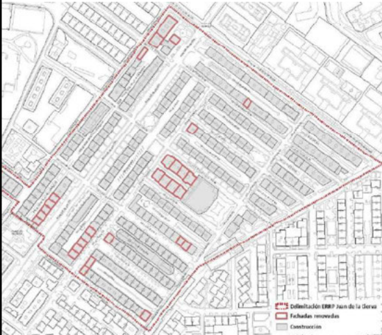
ERRP "Juan de la Cierva"

bitio. Edificios con fachadas renovadas dentro del ámbito.