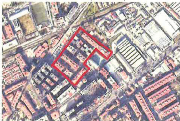
Ámbito de actuación