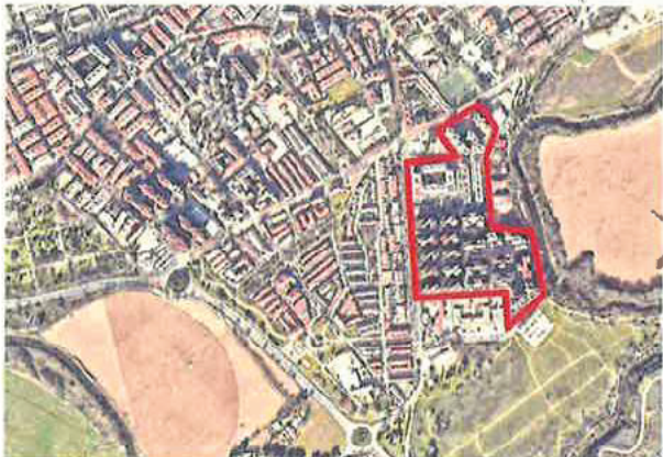
Ámbito de actuación