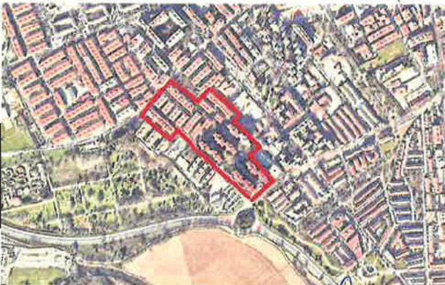
Ámbito de actuación