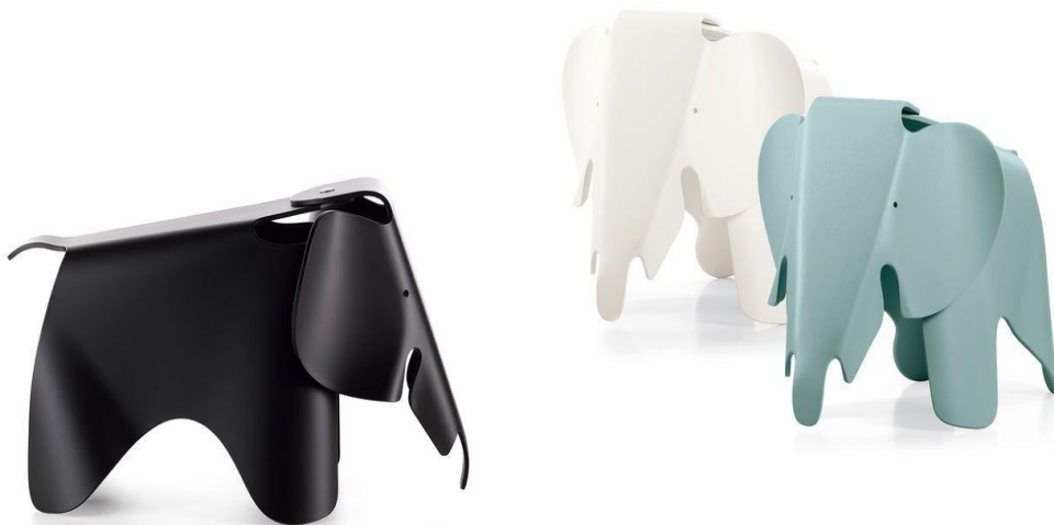
Imagen nº 4