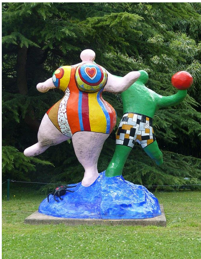
Imagen nº 2