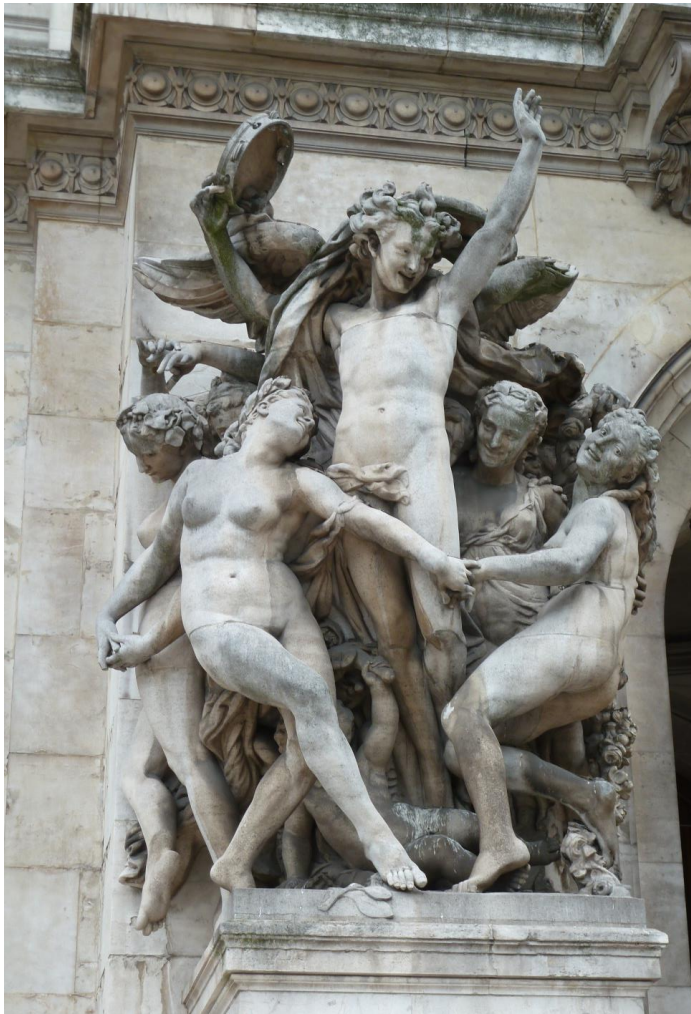
Imagen nº 10