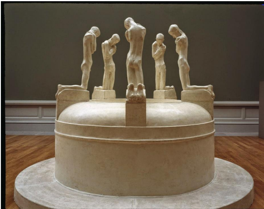
Imagen nº 8