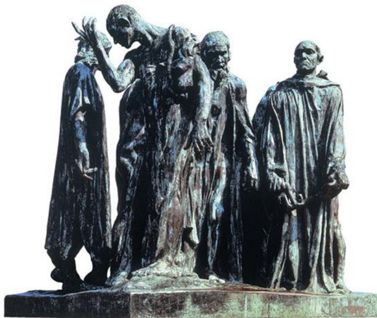
Imagen nº 1

“Descripción, análisis y contextualización de las siguientes obras a partir de las imágenes facilitadas”.