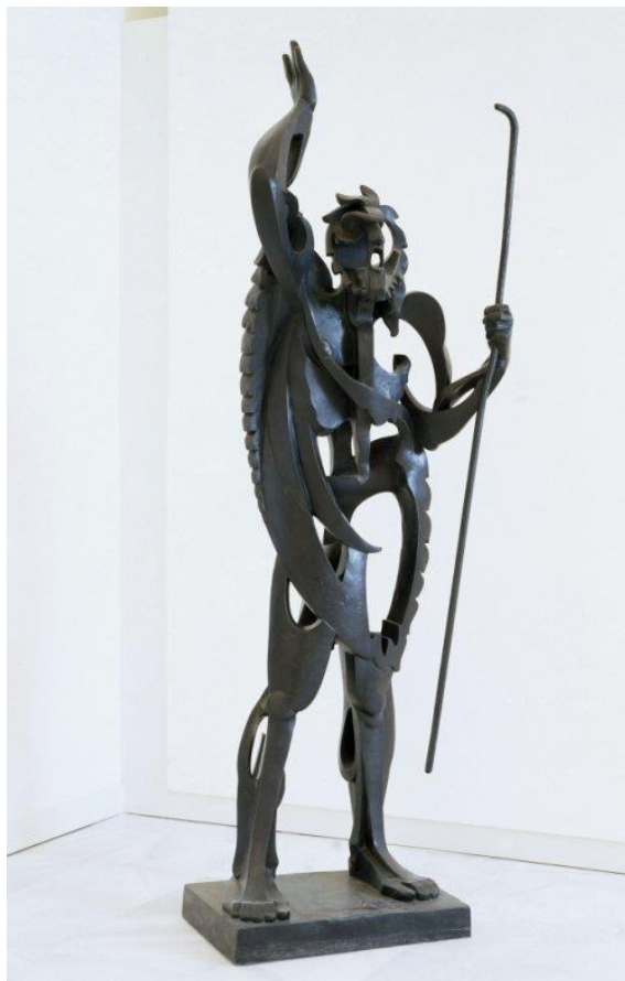
Imagen nº 6