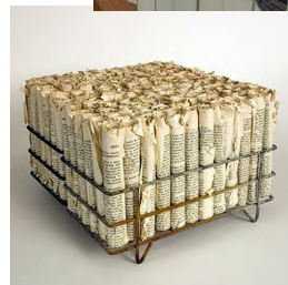
6 y 7_ Margaret Whiting