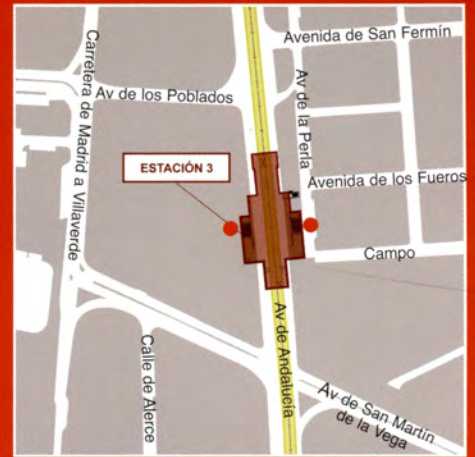
Avenida de Andalucía / Avenida de los Fueros