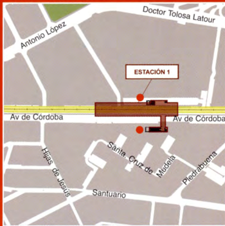
Avenida de Córdoba / Calle de Santa Cruz de Mudela