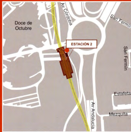
Avenida de Andalucía / Doce de Octubre