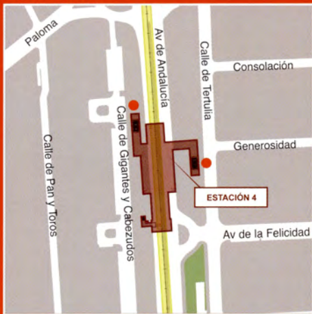
Avenida de Andalucía / Calle de la Generosidad