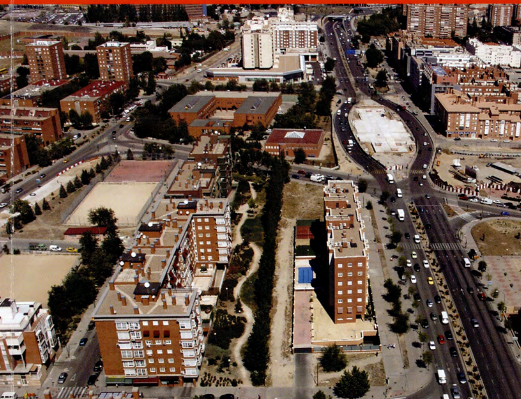
Estación de Villaverde Alto