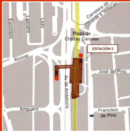
Avenida de Andalucía / Calle José del Pino