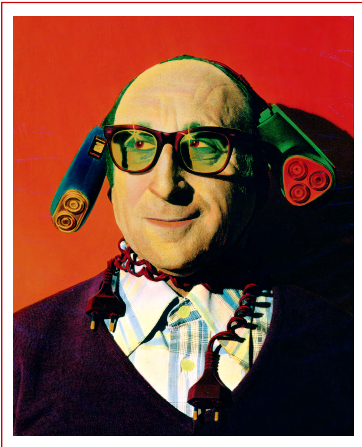
Peluquería Maquinilla, 1979 Autora: Ouka Leele Colección de María Rosenfeldt, heredera del legado de Ouka Leele

Ella juega con las composiciones y crea imágenes reconocibles pero que no son reales.