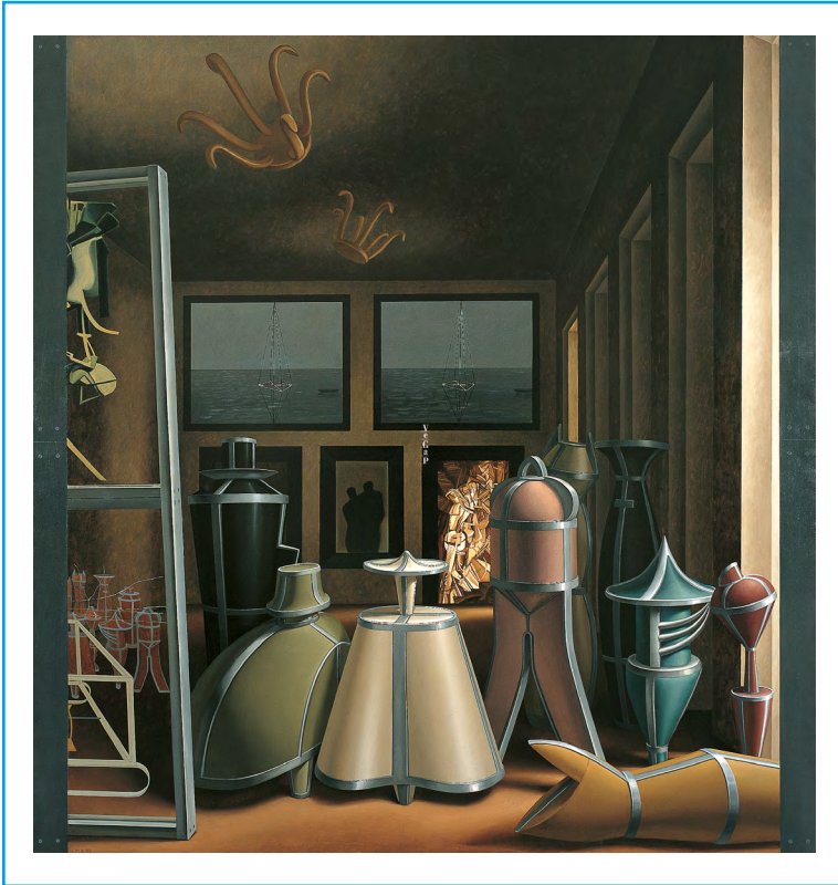
Meninas Malic, 1995 Autor: Sigfrido Martín Begué Colección Somoza de la Peña

→ Busca la obra Meninas- Malic Los autómatas.