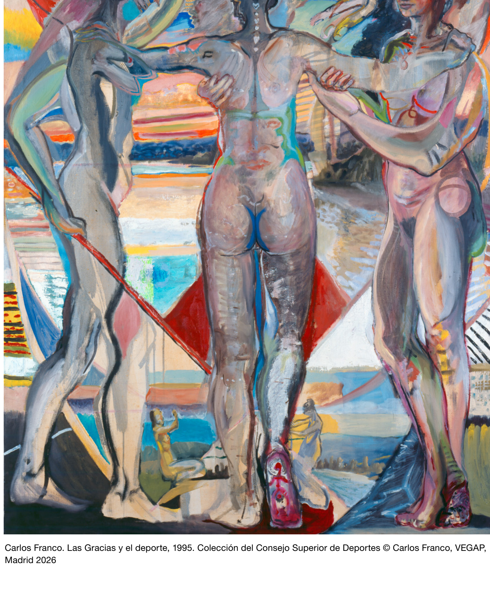
Carlos Franco. Las Gracias y el deporte , 1995. Colección del Consejo Superior de Deportes © Carlos Franco, VEGAP, Madrid 2026