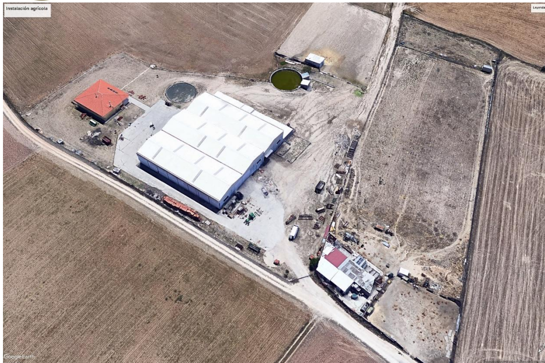
Figura 1. Instalación agrícola ubicada al norte en el buffer de 200 m con respecto a las instalaciones de las PSFV "Las Colinas" y "Moraleja".