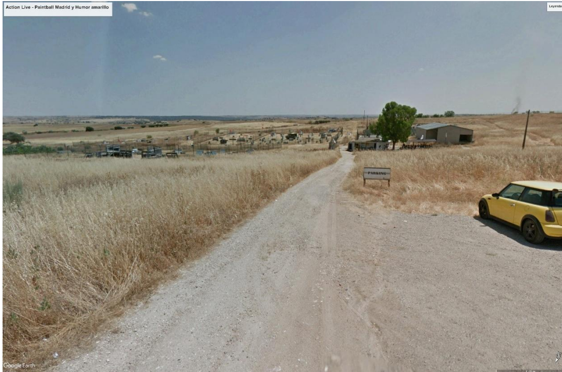
Figura 3. Paintball ubicado dentro del buffer de 200 m con respecto a las instalaciones de las PSFV "Las Colinas" y "Moraleja".

Estas edificaciones se encuentran fuera del trazado directo de las infraestructuras y no se prevén afecciones significativas sobre ellas durante la fase de ejecución del proyecto. No obstante, se recomienda mantener una coordinación preventiva con los propietarios en caso de que se produzcan movimientos de tierra o actividades que puedan generar molestias puntuales.