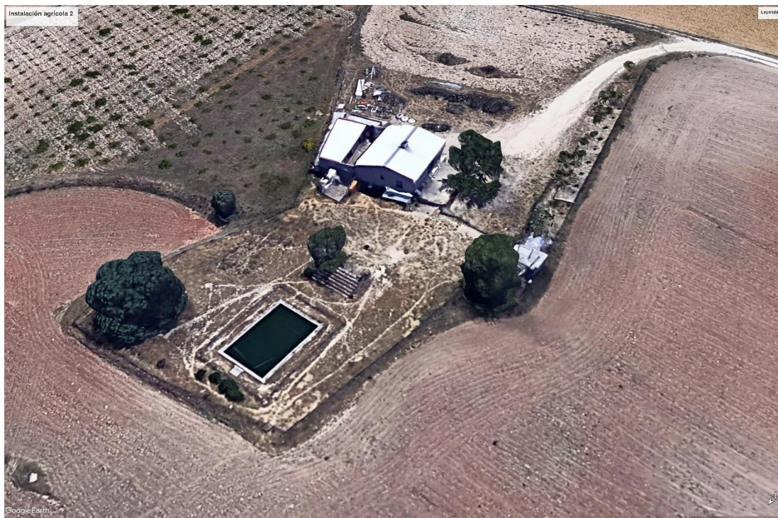
Figura 2. Instalación agrícola ubicada al norte en el buffer de 200 m con respecto a las instalaciones de las PSFV "Las Colinas" y "Moraleja".