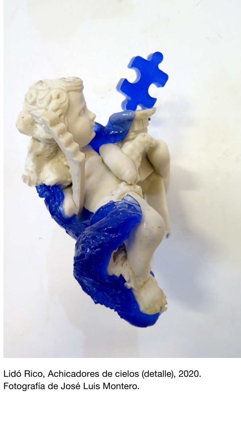
Lidó Rico, Achicadores de cielos (detalle), 2020.

La muestra ofrece una cartografía monumental que atraviesa más de tres décadas de creación del artista. Más que una retrospectiva convencional, la exhibición marca un punto de inflexión en su carrera, al trazar un arco narrativo que va desde sus primeras obras a finales de los años ochenta en cera y metal hasta la contundencia de sus proyectos más actuales en un continuo diálogo con el singular espacio arquitectónico de la Sala Alcalá 31. Este recorrido revela, con una intensidad poco común, la exploración de un lenguaje plástico fundamentado en el vaciado de su propio cuerpo, mostrando una evolución desde la captura de la huella física hacia una indagación sobre la identidad, la memoria, la historia y la condición humana en la que cada obra plantea un audaz juego entre aquello que permanece oculto y aquello que se muestra al espectador.