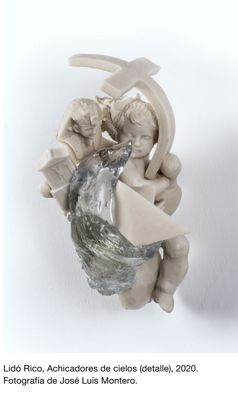
Lidó Rico, Achicadores de cielos (detalle), 2020.

Esta exposición demuestra que la obra de Lidó Rico es heredera de una larga tradición de arte afectivo y humanista. Conceptos como «terribilidad» o el «non-finito», usados por los contemporáneos de Miguel Ángel Buonarroti para definir la fuerza y la ira de esas miradas casi inhumanas que destilaban las obras del maestro italiano, están aquí más vivos que nunca en la magnitud de unas esculturas que nos conmueven a través de la mente y el estómago, en una interacción entre la visión del artista, la resistencia del material y la invitación al espectador a completar la obra desde su propio punto de vista.