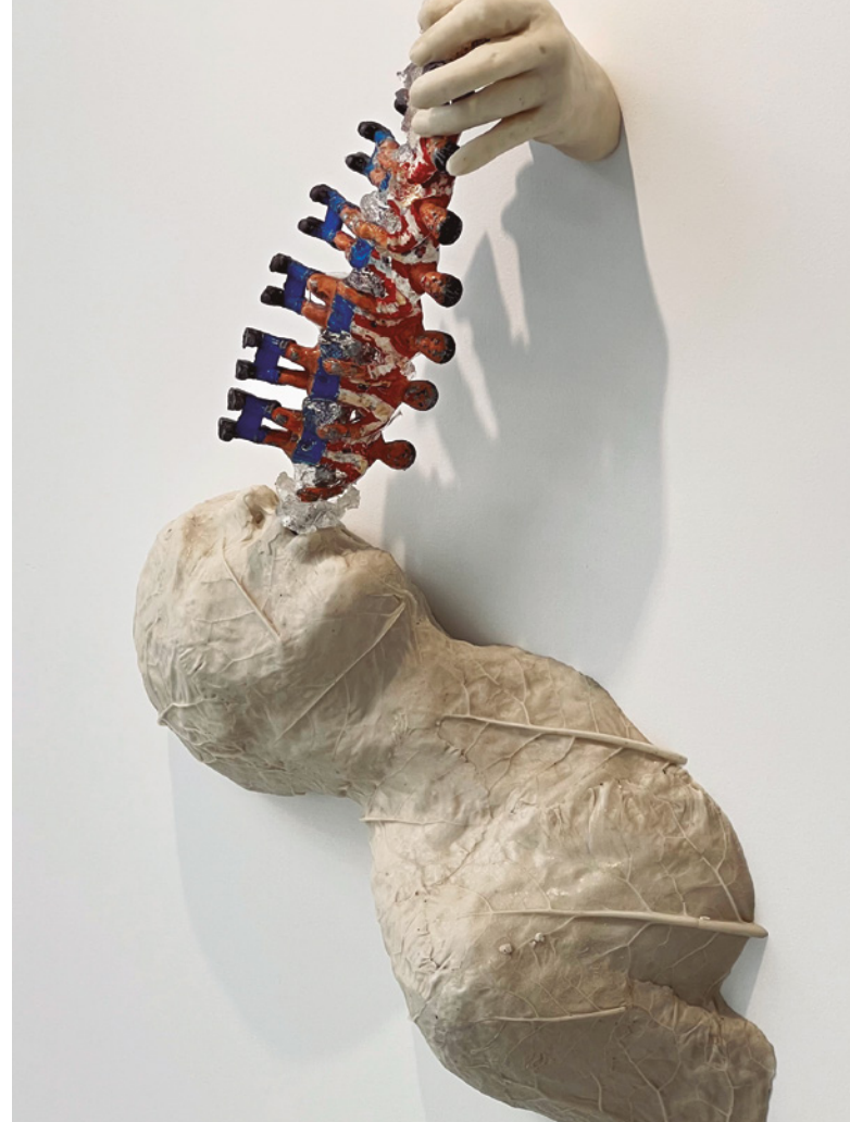
Lidó Rico, Espeto rojiblanco, 2021.

En la planta principal, que ofrece diversos recorridos en función de los temas conceptuales que alberga cada nave, resulta obligado destacar la presencia de dos obras de escala prodigiosa que atraviesan longitudinalmente la nave central. A modo de prólogo, la instalación «Secadero de pensamientos» introduce al visitante en el universo del artista; una multitud de cabezas suspensas nos hablan de presente y pasado, de vidas y acontecimientos, de anhelos e inquietudes que invitan a una reflexión sobre el paso del tiempo. Por su parte, el monumental mural «Murcia, piel y memoria» —encargo institucional del Ayuntamiento de Murcia para conmemorar los mil doscientos años de la fundación de la ciudad— compone un relato escultórico atravesando siglos, símbolos y generaciones, y convocando a una amplia representación de significativas personalidades de su historia viva.