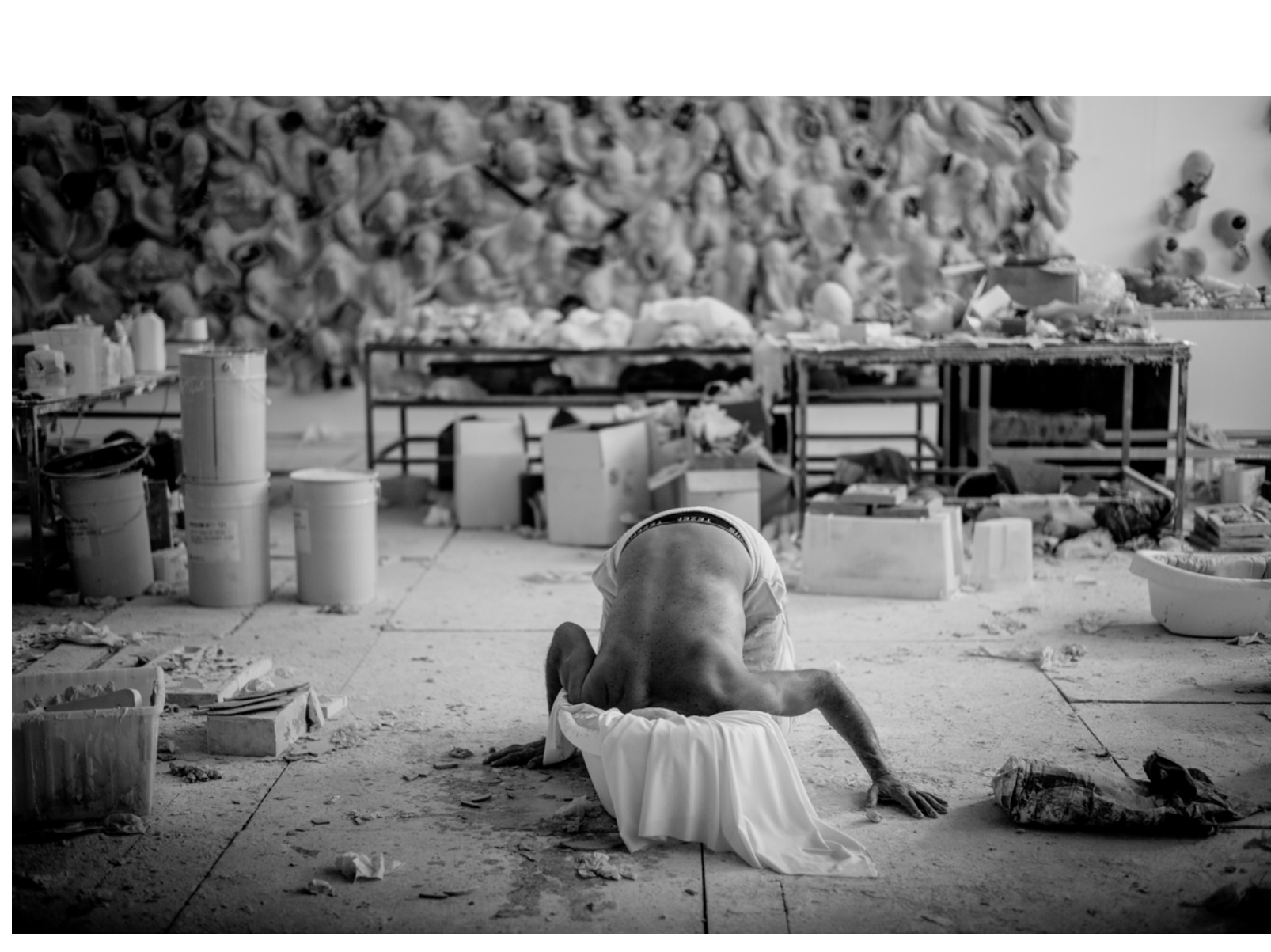
Proceso de trabajo de Lidó Rico.