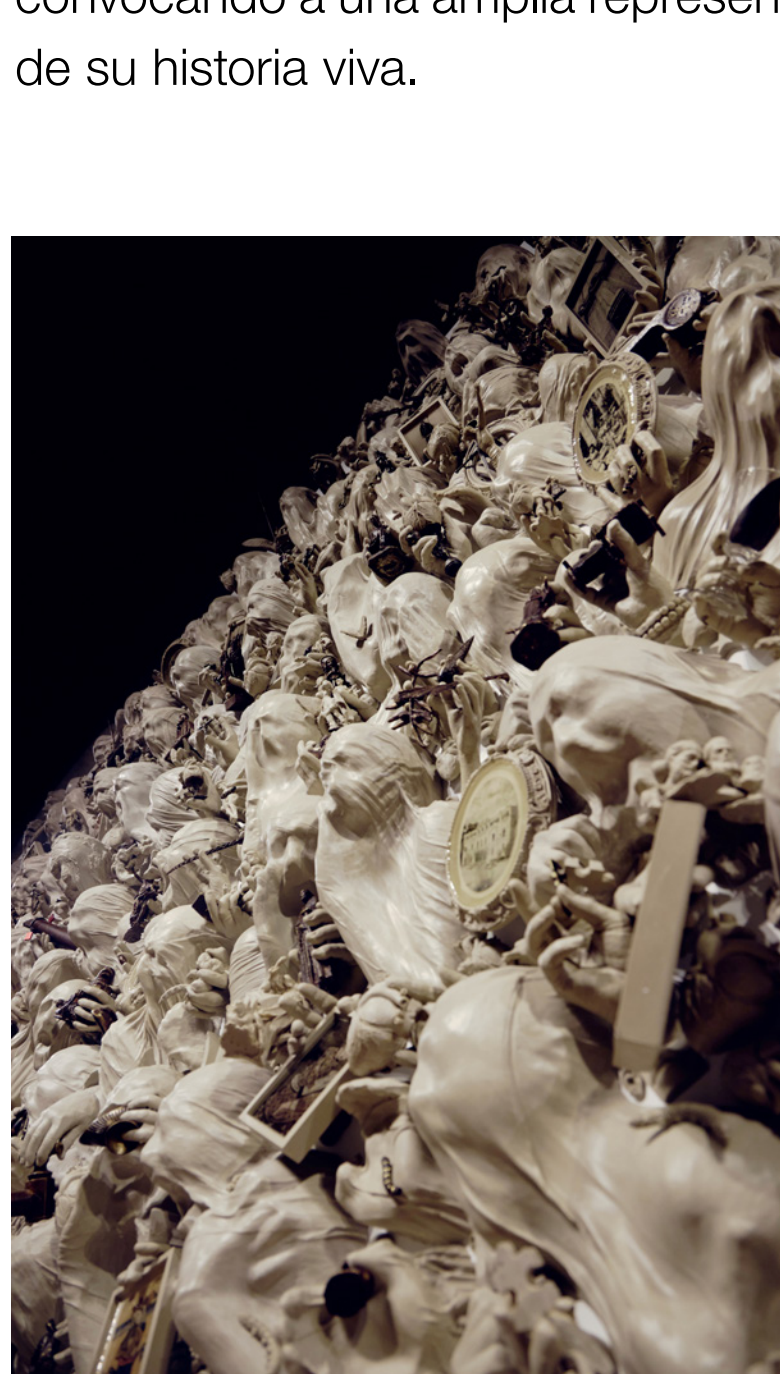
Lidó Rico, Murcia, piel y memoria (detalle), 2025.

En la planta principal, que ofrece diversos recorridos en función de los temas conceptuales que alberga cada nave, resulta obligado destacar la presencia de dos obras de escala prodigiosa que atraviesan longitudinalmente la nave central. A modo de prólogo, la instalación «Secadero de pensamientos» introduce al visitante en el universo del artista; una multitud de cabezas suspensas nos hablan de presente y pasado, de vidas y acontecimientos, de anhelos e inquietudes que invitan a una reflexión sobre el paso del tiempo. Por su parte, el monumental mural «Murcia, piel y memoria» —encargo institucional del Ayuntamiento de Murcia para conmemorar los mil doscientos años de la fundación de la ciudad— compone un relato escultórico atravesando siglos, símbolos y generaciones, y convocando a una amplia representación de significativas personalidades de su historia viva.