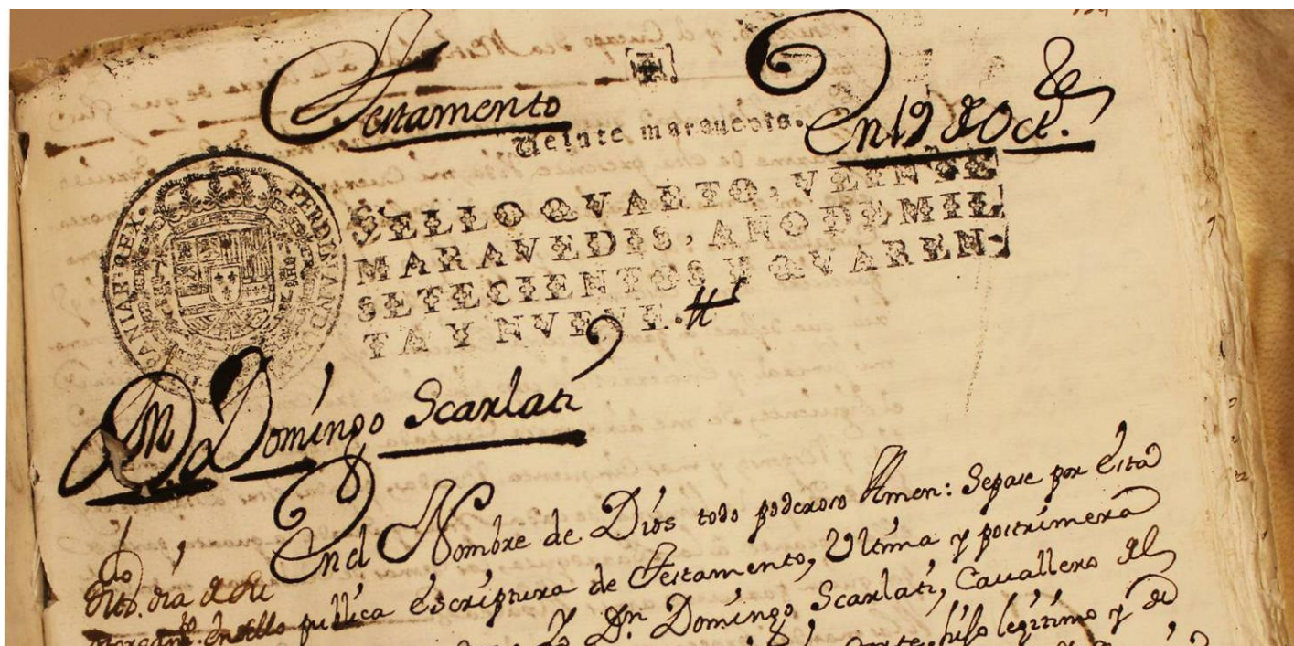
Inicio del testamento en el que puede observarse la castellanización del nombre y apellido del compositor, que aparece como Domingo Scarlati.