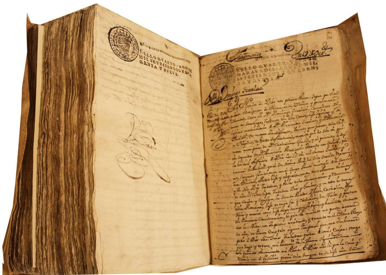
Legajo que contiene el testamento del compositor italiano Domenico Scarlatti. En la imagen, a la derecha, la primera página del documento.

El 'Documento del mes' que hoy presentamos, custodiado en el Archivo Histórico de Protocolos de Madrid es el testamento de Domenico Scarlatti, (Nápoles, Reino de Nápoles, 26 de octubre de 1685 - Madrid, Reino de España, 23 de julio de 1757) compositor italiano del periodo barroco afincado en España, donde compuso casi todas sus sonatas para clavicémbalo, por las que es universalmente reconocido.