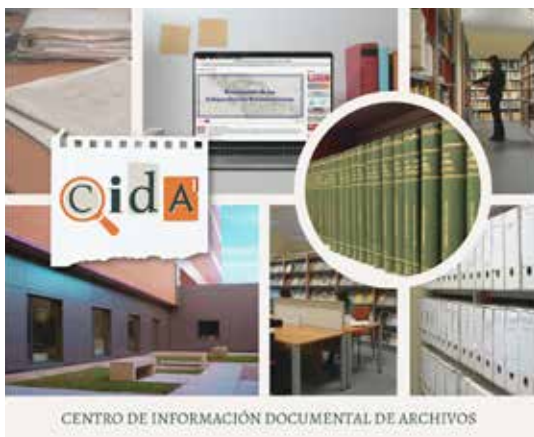
CENTRO DE INFORMACIÓN DOCUMENTAL DE ARCHIVOS