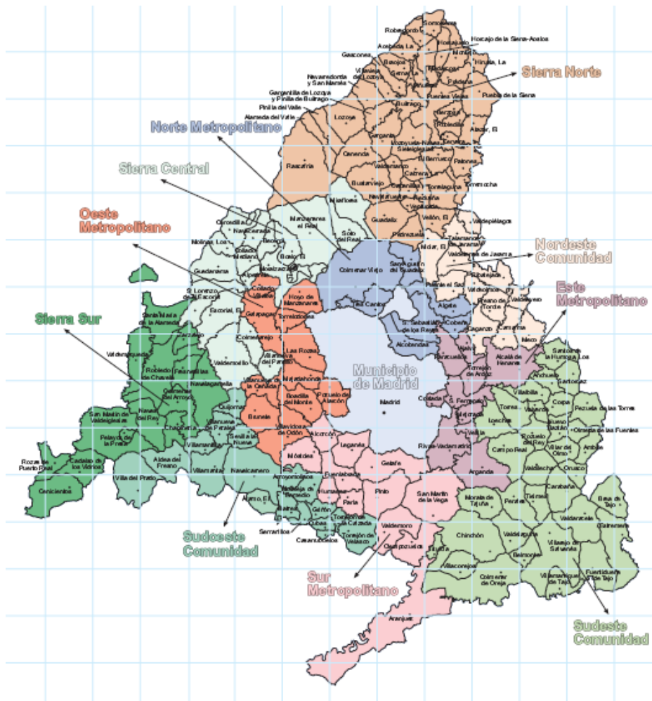
Mapa de la Comunidad de Madrid por municipios.