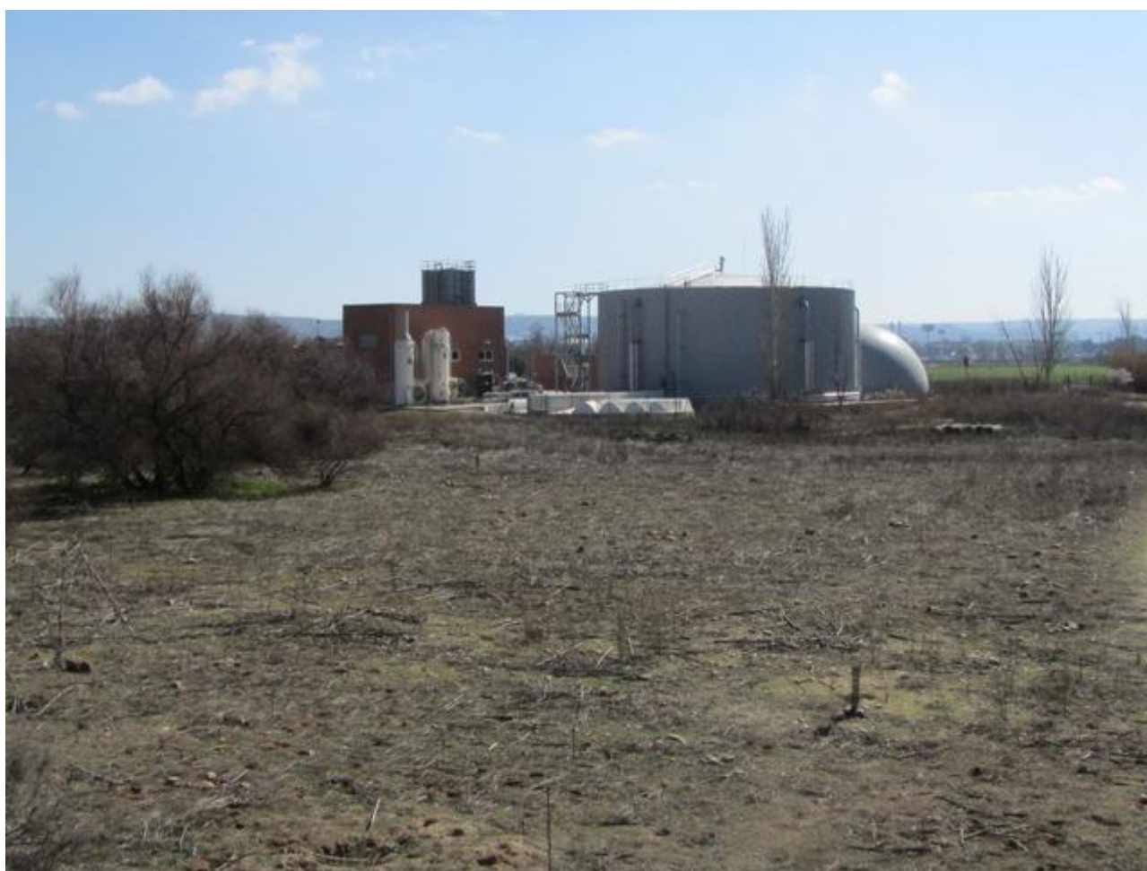
EDAR y terrenos aledaños, vista desde el NO

Según el estudio de vegetación del documento ambiental, la zona de ampliación de la EDAR y las de ocupación temporal están mayoritariamente ocupadas por vegetación herbácea degradada, apareciendo algunas manchas de carrizal y tarayal, así como restos de una repoblación reciente (castaño de indias, morera, níspero, fresno de flor), probablemente para restaurar una zona de ocupación temporal, y varios árboles ornamentales.