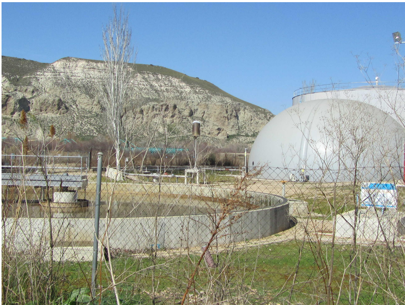
Instalaciones de la EDAR con los cantiles yesíferos de la margen derecha del Jarama al fondo