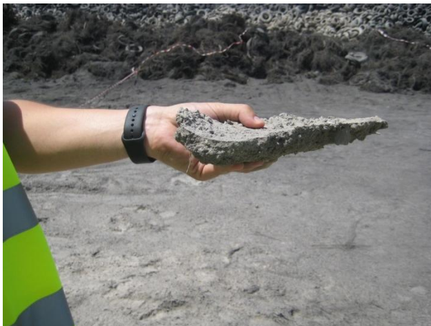
COSTRA DE CENIZAS IMPREGNADA CON EL POLIMERO