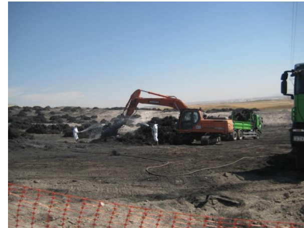
CARGA RESIDUOS METÁLICOS