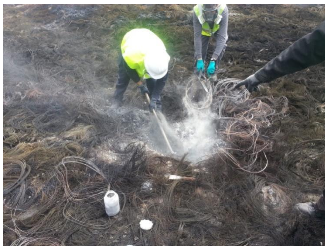
TOMA DE MUESTRAS