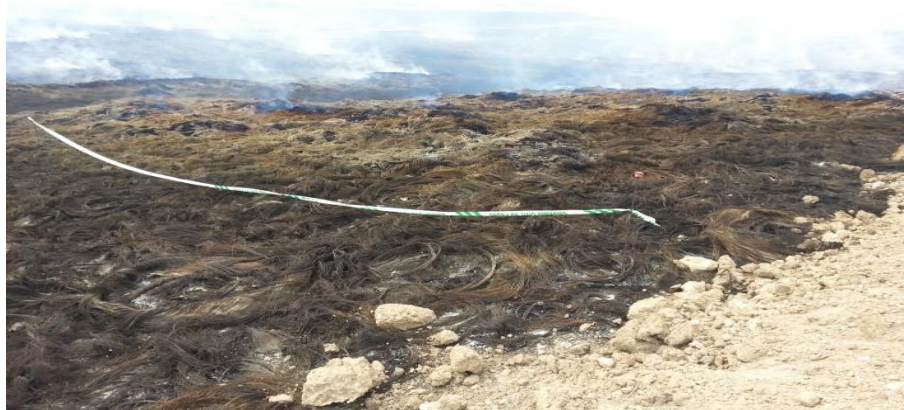
ASPECTO TRAS LA EXTINCIÓN