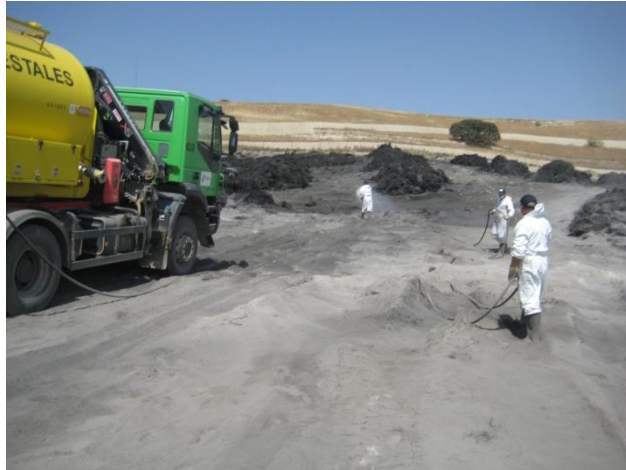
APLICACIÓN DEL POLIMERO