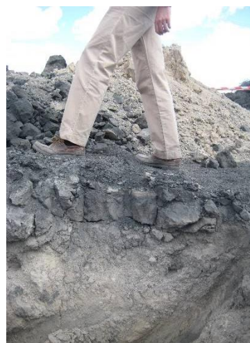
CATA CON RETROEXCAVADORA