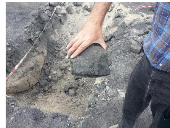
SUELO AFECTADO BAJO LAS CENIZAS