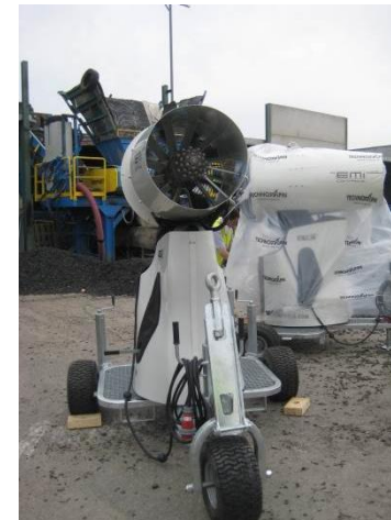
EQUIPOS DE PULVERIZACIÓN AGUA