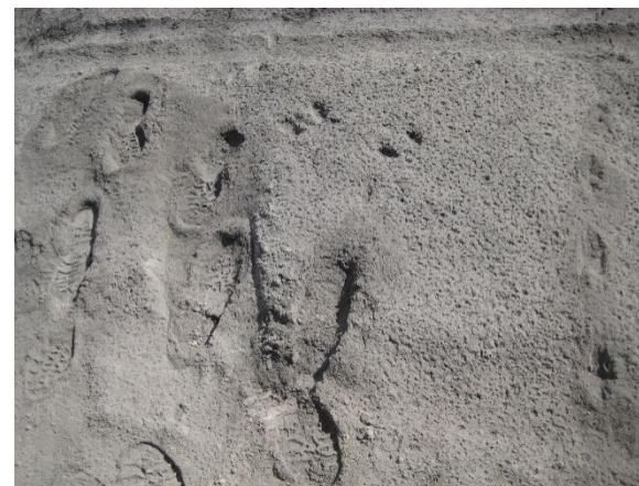
CAPA DE CENIZAS