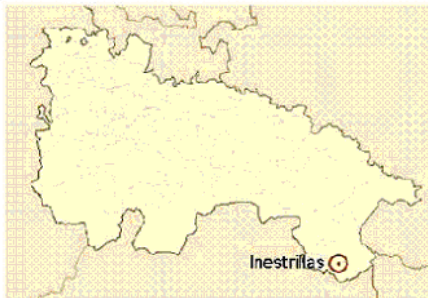
Ubicación de Inestrillas en La Rioja.