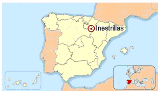
Ubicación de Inestrillas en España.

Salvo que no se complete el campo con voluntarios internacionales, se completaría con nacionales.