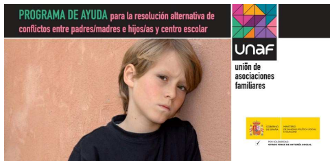
Padres/madres- hijos/as-centro escolar