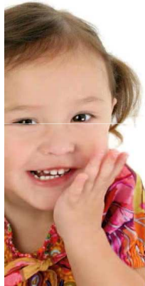
En separación o divorcio