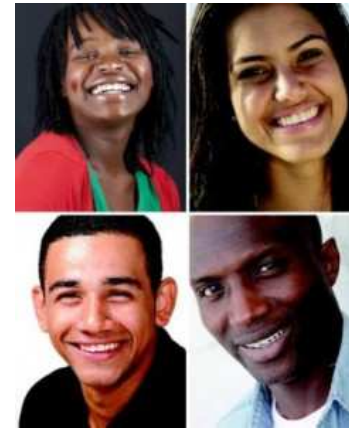
Promoción de la salud sexual en la población inmigrante