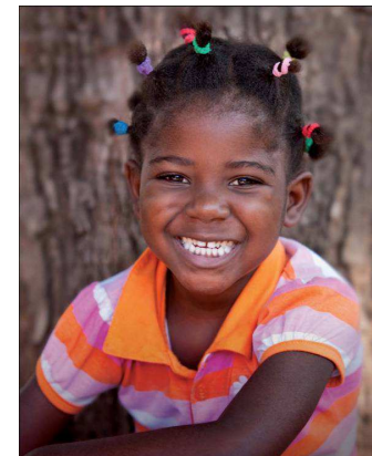
Prevención e Intervención contra la Mutilación Genital Femenina