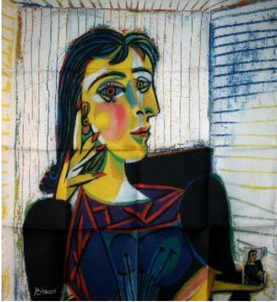
Detalle de Retrato de Dora Maar (1937)