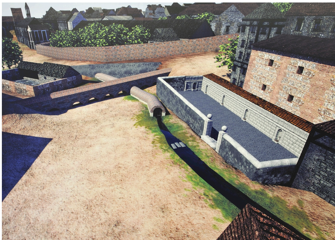
Fig. 14 Infografía de la plazuela de los Caños del Peral en el siglo XVII

Como en el caso de los restos de la iglesia de San Juan, con los distintos tipos de pavimento de la plaza podemos ver dónde se situaba cada uno de estos elementos que configuraban la plazuela. Asimismo, se ha colocado una reproducción del único caño de la fuente que ha llegado hasta nosotros, en el lugar en el que se detectó. En el interior de la estación de Metro se ha habilitado un pequeño centro de interpretación, donde se han colocado los restos extraídos durante las obras.