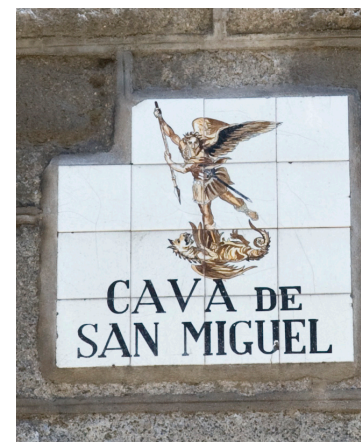
Fig. 18 Placa con el nombre de la Cava de San Miguel

En los números 4 y 6 de la plaza se conservan dentro de los edificios restos del lienzo de la muralla y de un torreón, pero no son visibles desde fuera. Desde Puerta Cerrada, la muralla continuaba por la Cava Baja y la calle del Almendro. En varios inmuebles de la Cava Baja (números 10, 21 y 30) se han documentado restos.