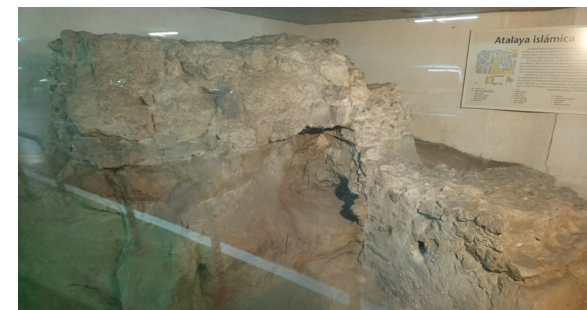
Fig. 10 Restos arqueológicos de la Torre de los Huesos en el interior del Parking Público de Ópera

Tras la conquista cristiana la torre debió ser incorporada a la muralla del segundo recinto fortificado, pasando a proteger la puerta y la torre de Valnadú y las fuentes de los Caños del Peral, situadas en la actual Plaza de Isabel II.