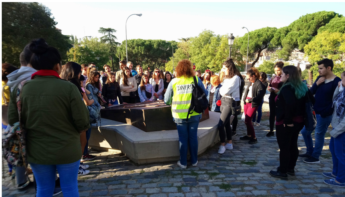
Fig. 1 Grupo de alumnos en la Cuesta de la Vega

Mayrit tuvo en su origen un carácter predominantemente militar, constituyendo un importante bastión en la frontera entre el Califato de Córdoba y los reinos cristianos, con un importante valor estratégico por su proximidad a la ciudad de Toledo, la ciudad más importante de la Marca Media , y a las rutas de acceso al territorio castellano.