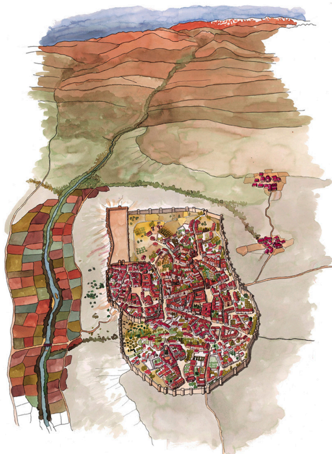
Fig. 2 Reconstrucción de los recintos amurallados medievales de Madrid

Estas características del terreno condicionaron el posterior crecimiento de Madrid. La ciudad tuvo que extenderse por los espacios más accesibles, primero hacia el este (siguiendo la calle Mayor), y después hacia el norte, y el sur.