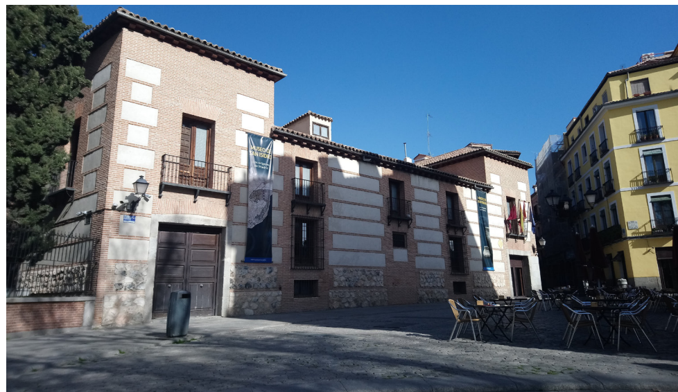
Fig. 23 Fachada principal del Museo de los Orígenes

Recientemente, esta hipótesis parece quedar confirmada por los últimos hallazgos arqueológicos realizados en la Plaza de la Armería, los cuales han permitido documentar una ocupación por parte de población judía en diversos ámbitos domésticos datados entre finales del siglo XIII y el siglo XIV.