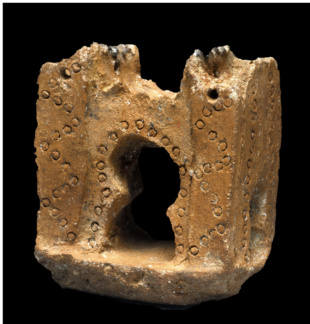
Fig. 3 Puerta califal. Terracota del siglo XI. Yacimiento Casa de San Isidro

El lienzo de muralla visible tiene 120 metros de longitud, unos 8 metros de altura (faltaría el remate con las almenas y merlones que no se ha conservado) y 2 metros de