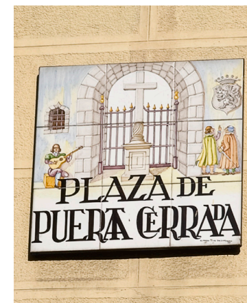
Fig. 19 Placa con el nombre de Plaza de Puerta Cerrada