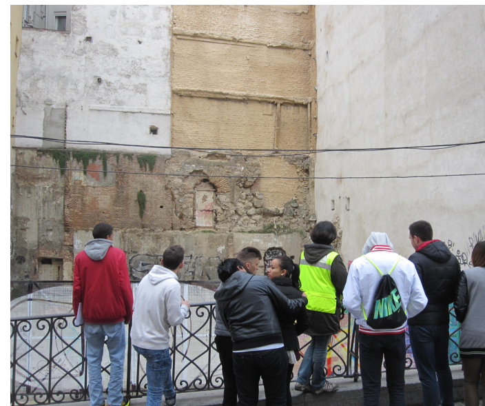
Fig. 17 Grupo de alumnos junto a los restos de la muralla cristiana en la calle Escalinata

Tras la Batalla de las Navas de Tolosa , en 1212, y la victoria de los cristianos frente a los almohades, la línea fronteriza entre cristianos y musulmanes se descendió de la cuenca del Tajo hacia el sur, entrando en Andalucía. El recinto cristiano va perdiendo poco a poco su función defensiva, comenzando el declive de la muralla por falta de mantenimiento e iniciándose lo que llamamos arrimos.