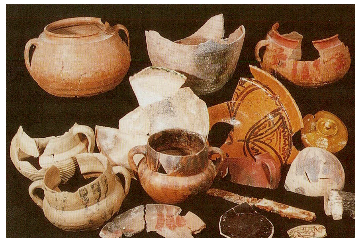
Fig. 22 Cerámicas hispanomusulmanas procedentes de uno de los silos del yacimiento de la Casa de San Isidro