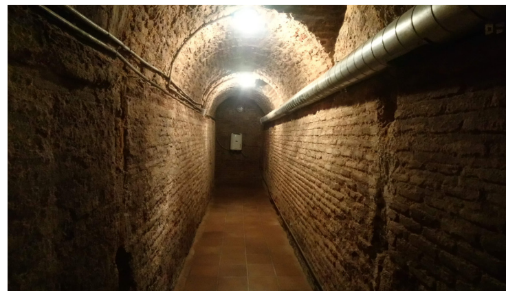
Fig. 16 Tramo del Viaje de agua conservado en la Real Academia de Ingeniería

En consecuencia, la red de viajes de agua que hoy conocemos como tal sería el resultado de la política de infraestructuras iniciada a comienzos del siglo XVII, con la Corte ya establecida en la Villa y con un aumento muy importante de la población.