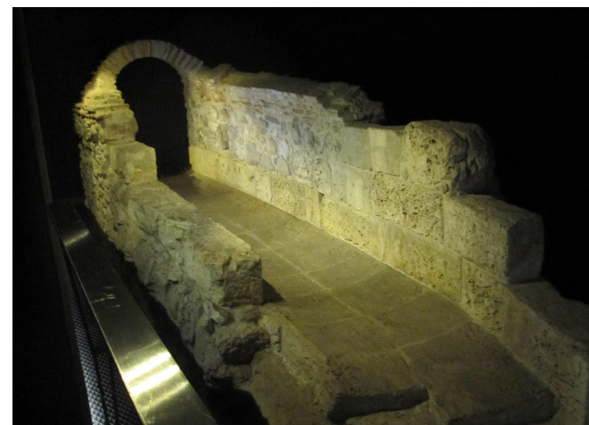
Fig. 13 Restos de la Alcantarilla del Arenal