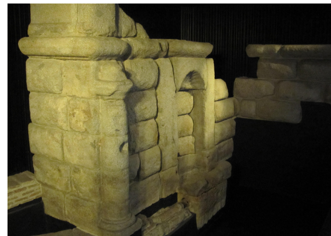
Fig. 12 Restos de la Fuente de los Caños del Peral