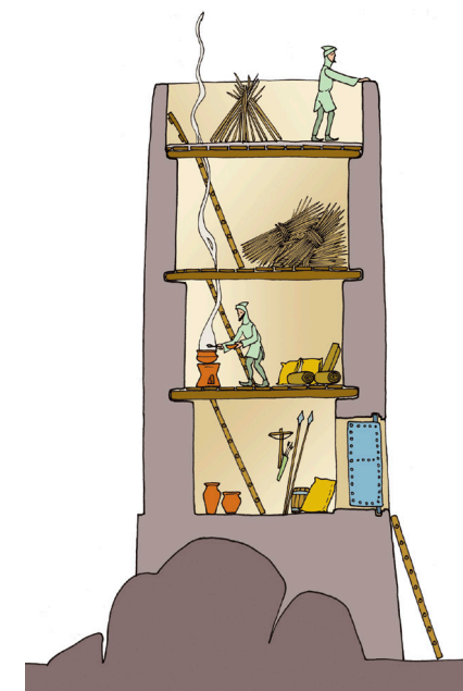
Fig. 11 Estructura interior y funcionamiento de una atalaya medieval

La Torre de los Huesos estaba fuera del recinto islámico, en el borde del barranco de Hontanillas, y permitía controlar visualmente los pozos y las instalaciones artesanales que se habían ido instalando en esta zona al crecer la población fuera de las murallas, sobre todo a partir del siglo XI.