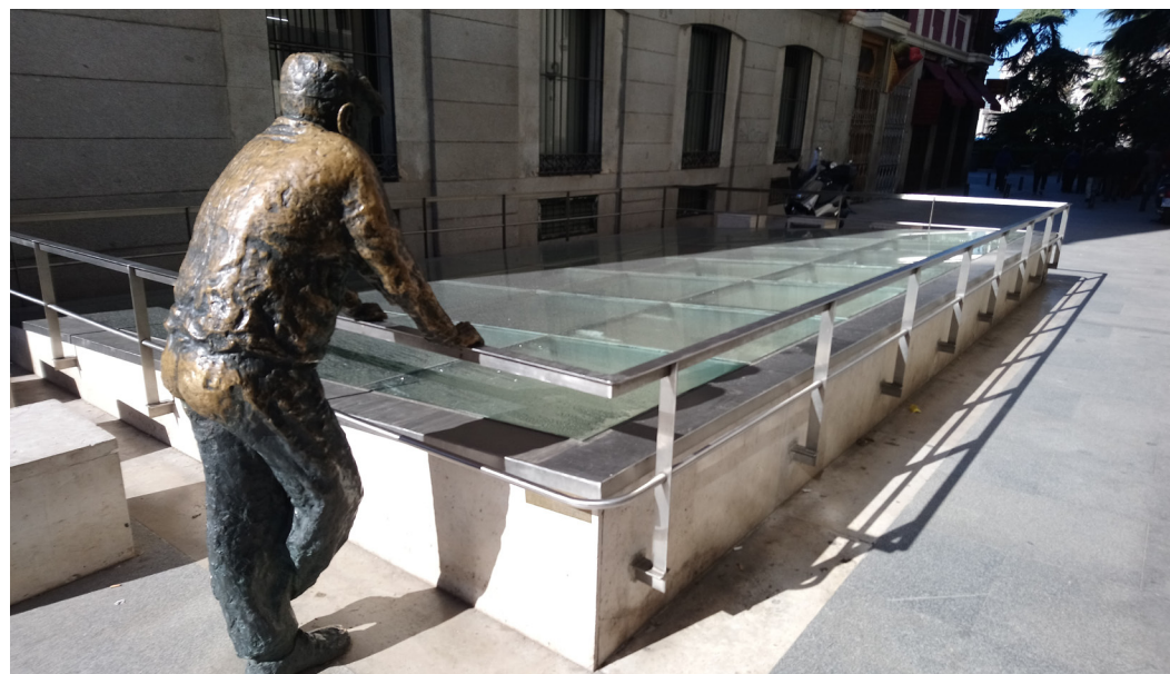
Fig. 6 Restos arqueológicos de la iglesia de la Almudena

La iglesia de la Almudena fue la principal iglesia de Madrid durante la Edad Media. El templo era un edificio pequeño, situado en la manzana comprendida entre las calles Mayor, Bailén y Almudena, solar que según los cronistas fue ocupado anteriormente por una mezquita. En los siglos XVII y XVIII fue reformada. Por su mal estado de conservación y con el objetivo de ensanchar la calle Mayor y alinear las manzanas de la zona fue derribada en 1868. En 1998 se llevó a cabo una intervención arqueológica que dejó al descubierto las cimentaciones y refuerzos de la zona de la cabecera que podemos ver actualmente.