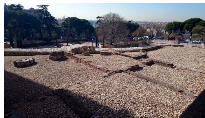
Fig. 5 Restos de las estructuras levantadas entre los siglos XVII y XIX sobre la muralla islámica en el Parque del Emir Mohammed I