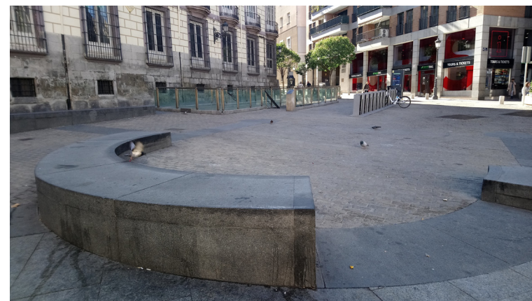
Fig. 9 Restos arqueológicos de la iglesia de San Juan Bautista en la Plaza de Ramales

La iglesia de San Juan Bautista es una de los templos mencionados en el Fuero de Madrid, aunque posiblemente fue reedificada en 1254. A partir del siglo XV se levantaron varias capillas y a mediados del siglo XVII fue ampliada. Entre 1810 y 1811 fue demolida por José Bonaparte , el hermano de Napoleón, enviado a España para ser el nuevo rey en sustitución de los Borbones. José I quería transformar Madrid y abrir plazas en algunos puntos para que hubiese más espacio y aligerar así el trazado urbano de la villa, con demasiadas calles estrechas. Por este motivo, en Madrid se le conocía con el apelativo de “el rey plazuela” . Para crear el espacio abierto de la Plaza de Ramales ordena derribar la iglesia de San Juan Bautista.