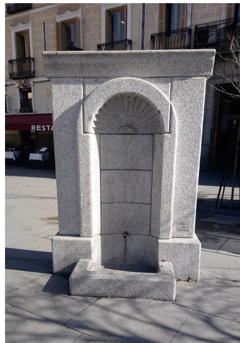
Fig. 15 Reproducción del único caño conservado de la Fuente. Plaza de Isabel II