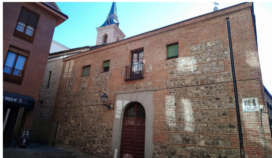
Fig. 8 Fachada posterior de la iglesia de San Nicolás

Las colaciones o vecindarios que surgían en torno a estas iglesias eran pequeños barrios muy próximos entre sí. Esto puede verse muy bien en la escasa separación que hay entre los restos de la antigua iglesia de la Almudena y la iglesia de San Nicolás.