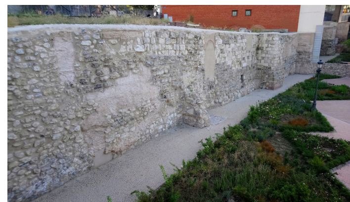
Fig. 4 Tramo de la muralla islámica conservado en el Parque del Emir Mohammed I

Los portillos o postigos eran pequeños accesos que se abrían en las murallas en los puntos más bajos del terreno. Además de ser entradas auxiliares servían para evacuar el agua de lluvia y sacar al exterior los desechos domésticos para que no se acumulasen en el interior de los recintos amurallados. De esta forma cerca de ellos se formaban basureros, rodaderos o muladares que podían tener varios metros de profundidad.