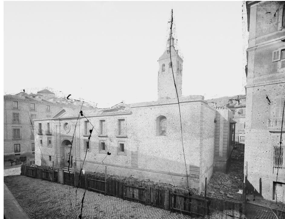
Fig. 7 Fachada de la antigua iglesia de la Almudena antes de su derribo en la segunda mitad del siglo XIX

Según la tradición popular, la imagen de la Virgen de la Almudena fue encontrada en 1085 por los cristianos tras la conquista de la ciudad, dentro de una de las torres de la muralla árabe, cerca de la Puerta de la Vega. La escondió allí un herrero al llegar los musulmanes a la península en el 711. Este relato no tiene ningún respaldo documental ni arqueológico, ya que la muralla se construye 150 años después de la llegada de los musulmanes. Lo más probable es que la imagen fuese tallada en la Baja Edad Media. La imagen actual es gótica y se conserva en la catedral de la Almudena.