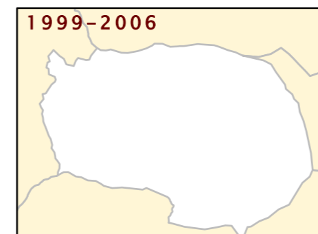
Suelo ocupado por períodos